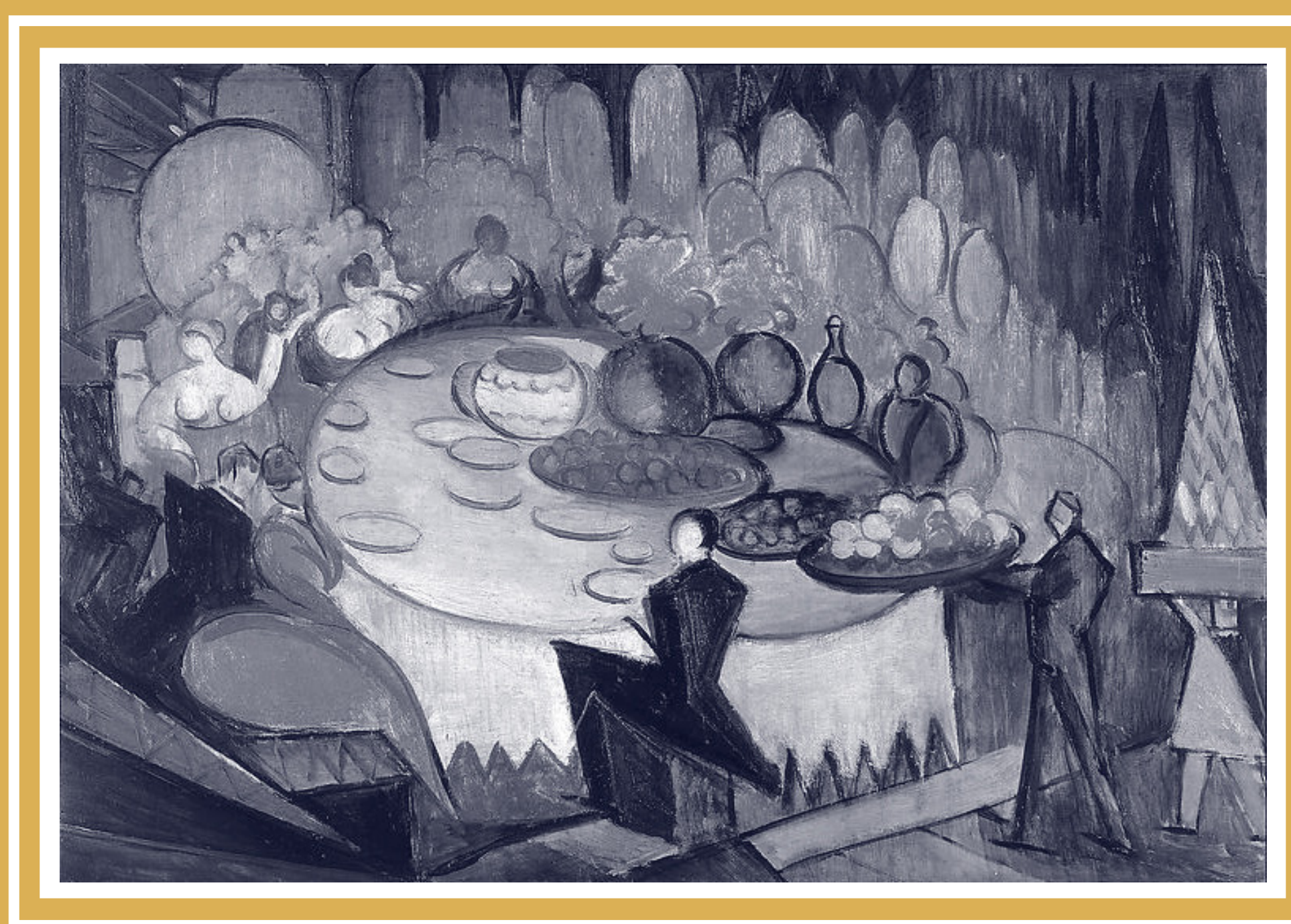
Leon Chwistek, „Uczta”, ok. 1925, olej na płycie pilśniowej, Muzeum Narodowe w Warszawie

Styl, który był modny we wzornictwie dwudziestolecia międzywojennego, jest również widoczny w rzeźbie tamtego okresu. Piękne cięte w drewnie figury tworzone przez Jana Szczepkowskiego konkurowały z awangardą Władysława Strzemińskiego i Katarzyny Kobro, pracami Xawerego Dunikowskiego, oscylującego na styku klasycyzmu i abstrakcji, czy z delikatnymi liniami „Rythmu” Henryka Kuny. To właśnie „Rythm” można uznać za kwintesencję stylu art déco – doskonale opracowane płaszczyzny rzeźby współgrały ze sobą, tworząc bryłę pełną subtelności, skończoną i przemyślaną, bez zbędnych ozdóbek.