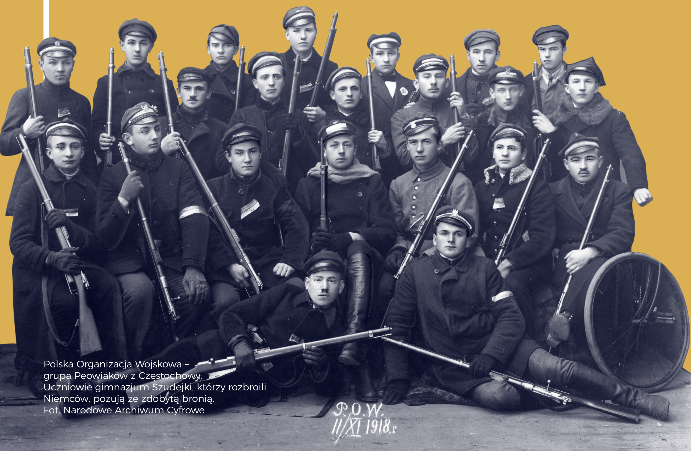
Polska Organizacja Wojskowa – grupa Peowiaków z Czestochowy. Uczniowie gimnazjum Szudajki, którzy rozbili Niemców, pozują ze zdobytą bronią.